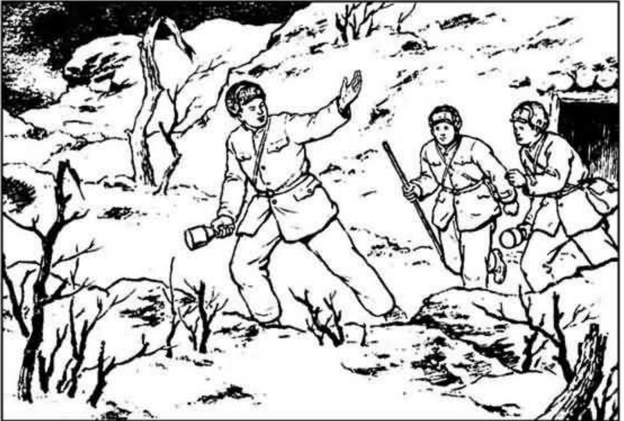
(77) 他提着手雷，领着两个战友向前冲去。