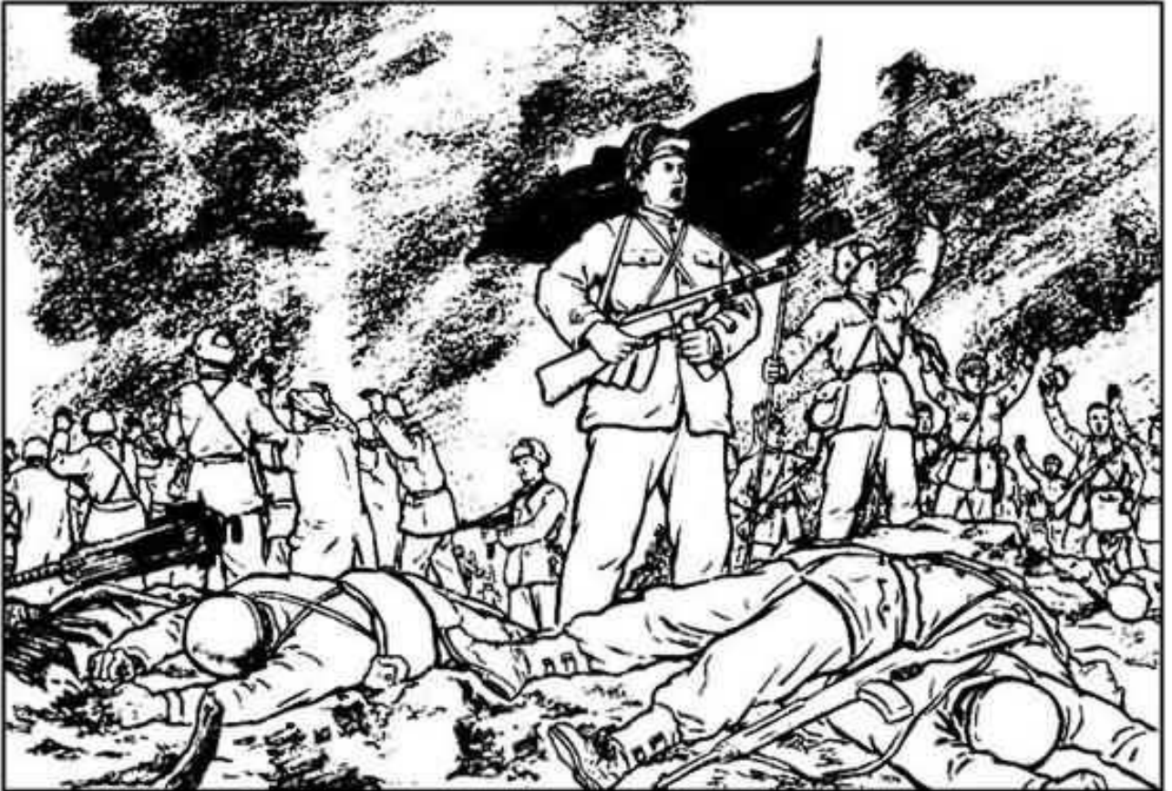
(91) 在激烈的战斗中，守在上面的一千二百多敌人被全部歼灭了。