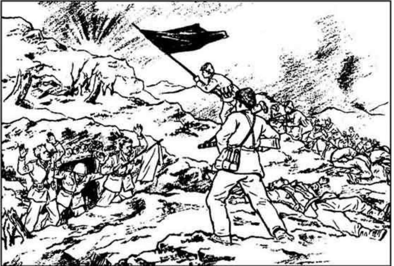
(90) 我军的反击部队像浪涛一样地卷上山头，很快就占领了阵地。